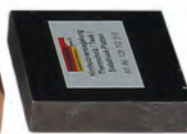
Siebdruckplatte/Thermoholz Art.Nr. 999 001 135