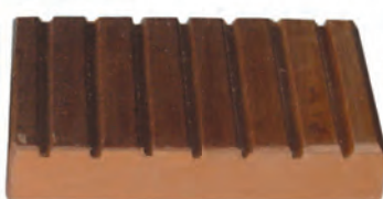
Bangkirai Art.Nr. 999 001 124